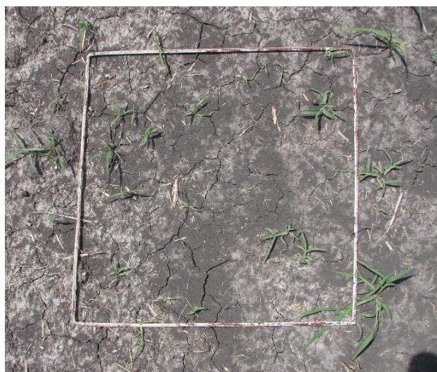
Figura 1. Cuadrante de muestreo (0,25 m 2 ).

Luego de marcadas las parcelas (Fig. 2), se pulverizaron el 12/10/2015 con un desecante (Paraquat) a la dosis recomendada para siembra directa de 552 g i.a. ha -1 (276 g e.a. litro -1 ).