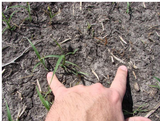
Figura 3. Momento del recuento donde se observan plántulas quemadas y nuevos nacimientos.

La emergencia acumulada se estimó mediante la fórmula: k = k' / kt , donde k es el porcentaje de emergencia, k' es el número de plántulas emergidas y kt es el número de emergencia total (Picapietra y Acciaresi, 2015).