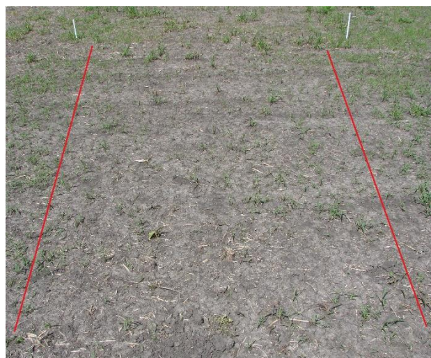
Figura 2. Parcela tratada con desecante a 15 DDA.

Los recuentos de plántulas se iniciaron 15 días luego de la aplicación (DDA) (Fig. 3) con una frecuencia de 12-15 días aproximadamente. Una vez realizado el recuento inicial se efectuó el control